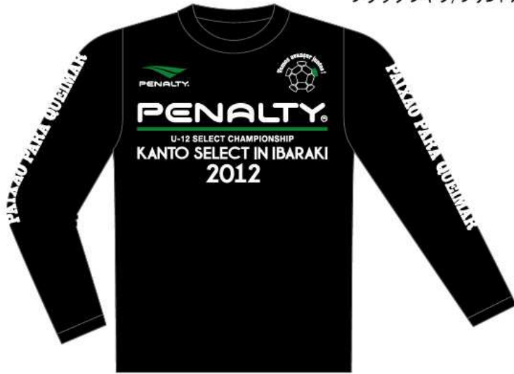
ブラックシャツ/プリントカラー/ホワイト×グリーン